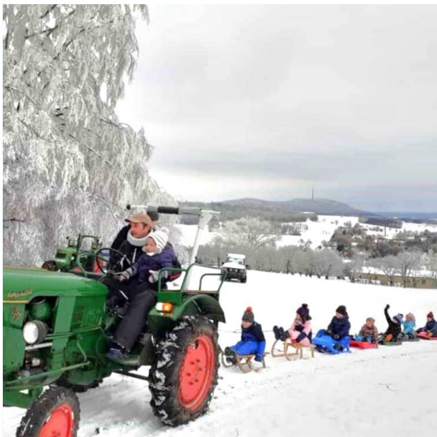
Schlittenfahren an der Blockhütte