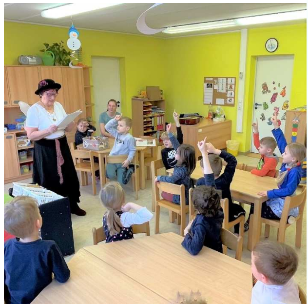
Die Märchenfee in der Kita „Rotsteinzwerge“