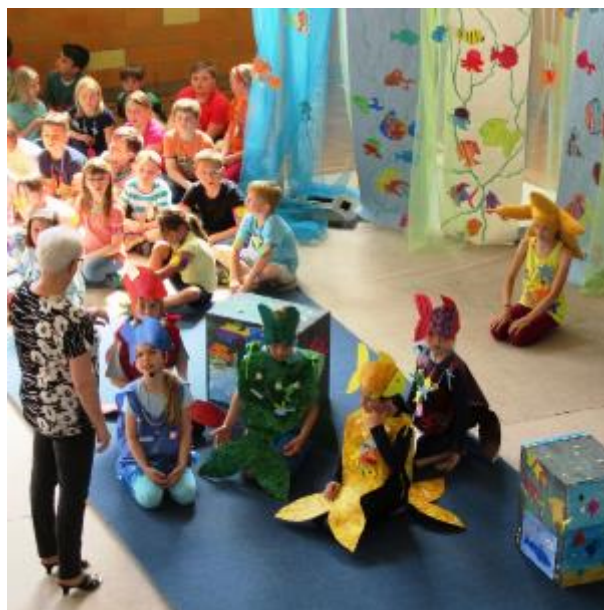
Ein tolles Bühnenbild in der Sporthalle

In diesem Gemeindeblatt erfahren Sie unter anderem: