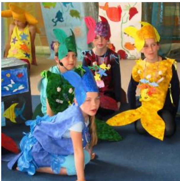
Grundschüler als Sänger und Schauspieler