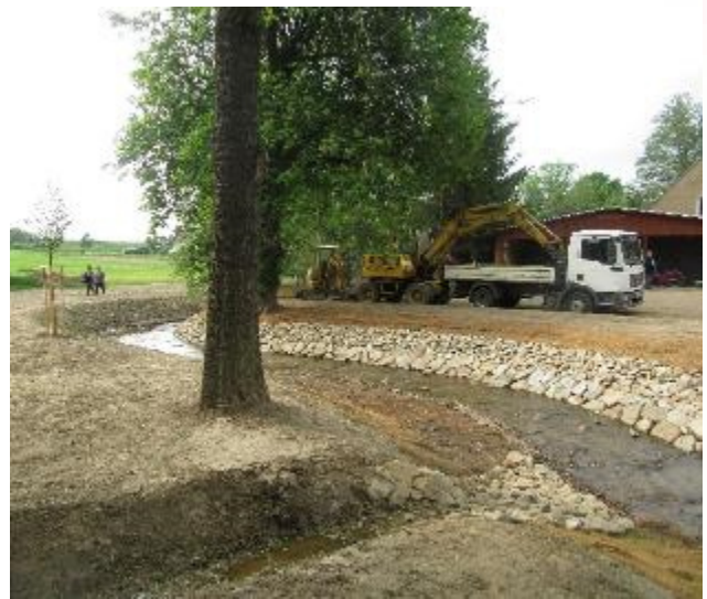
Bauabschnitt Bereich Untere Dorfstraße 106