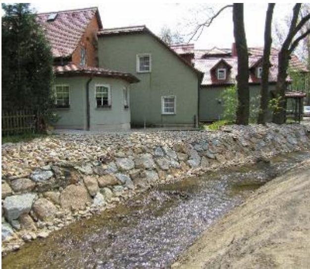
Bauabschnitt Bereich Mittelmühle