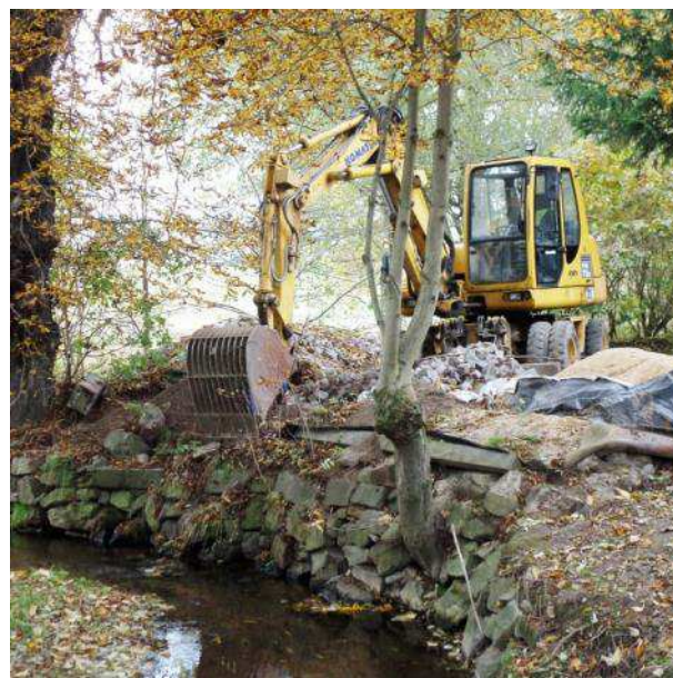
Beseitigung Hochwasserschäden 2013

In diesem Gemeindeblatt erfahren Sie unter anderem: