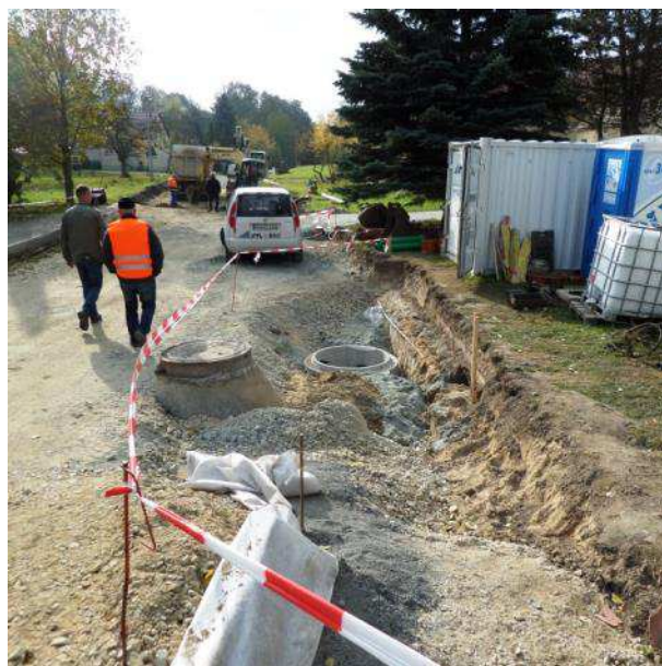
Straßenbau 2. BA S 143 Dorfstraße