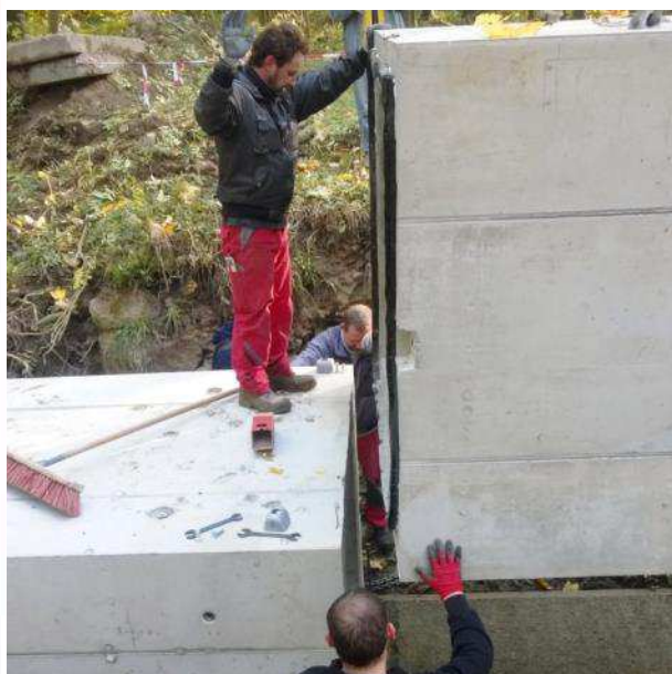
Erneuerung Durchlass am Hofweg