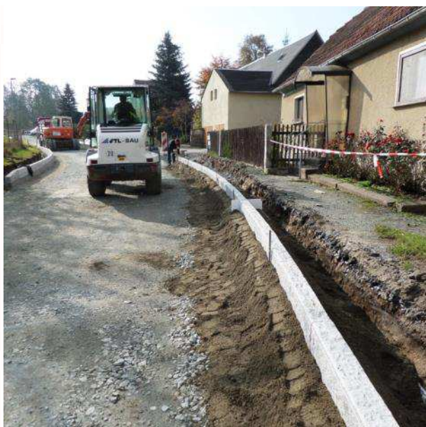
Straßenbau 1. BA S 143 Dorfstraße