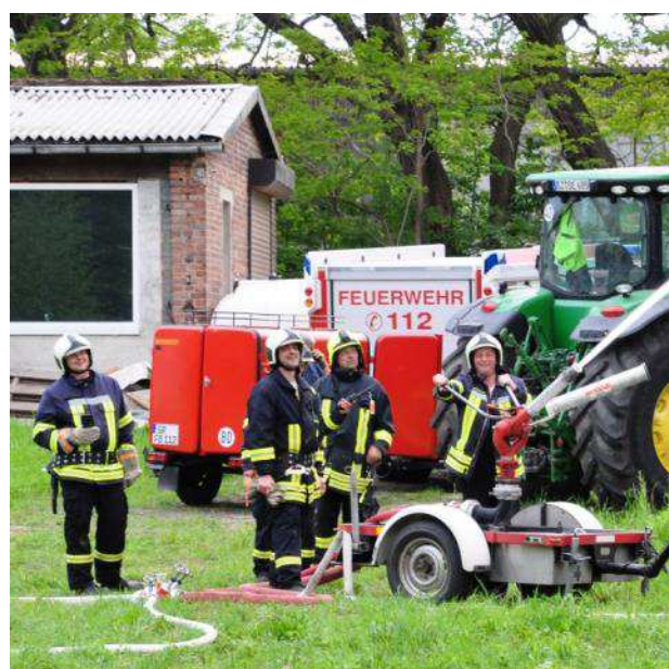
Die Kameraden aus Bischofshausen beim Löschen des simulierten Brandes

In diesem Gemeindeblatt erfahren Sie unter anderem: