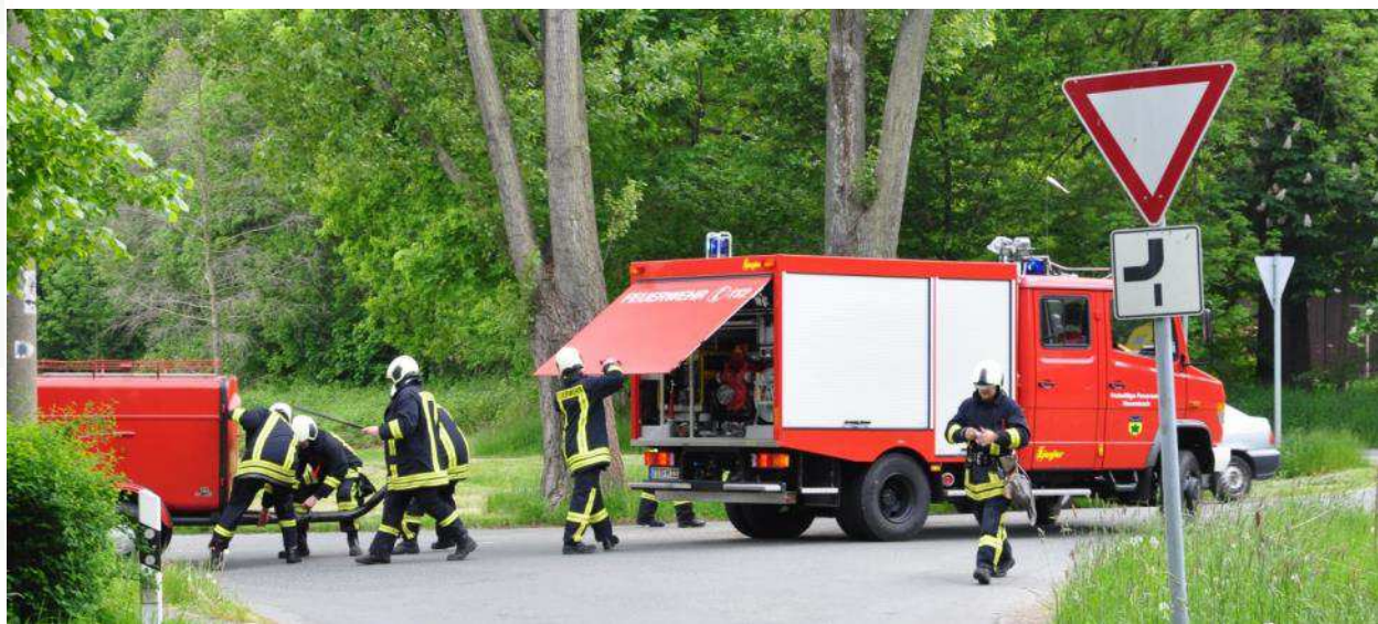
Die Herwigsdorfer Kameraden beim Auslegen der Schläuche zur Brandstelle