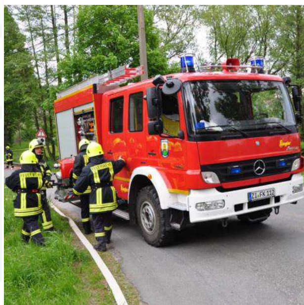
Auch Kameraden der Ortsfeuerwehr Kemnitz waren an der Übung beteiligt