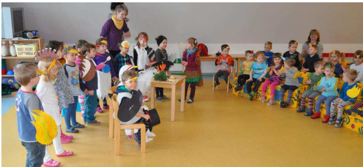
Gespannt lauschen die kleinen Zuschauer dem Festprogramm