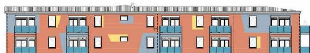
Ansicht – Wohnen

ASB-Ortsverband Löbau e. V. Güterstraße 14 • 02708 Löbau Telefon: 03585 8664-30