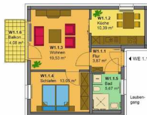
Beispiel – 2-Personen-Wohnung

Darüber hinaus steht jeder Wohnung ein Abstellraum zur Verfügung.