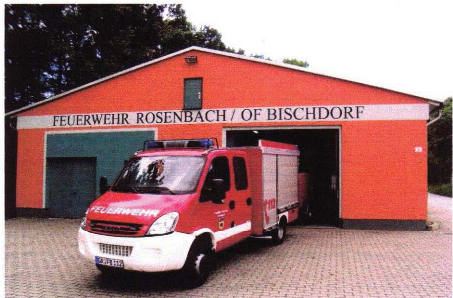
Feuerwehrrätehaus erstrahlt in neuem Glanz

Stolz, aber auch dankbar übernahmen der Gemeinde- und der Ortswehrleiter vom Bürgermeister symbolisch die Fahrzeugschlüssel. Der Freistaat Sachsen förderte die Beschaffung mit 58 T€.