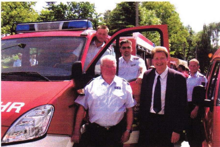
Feierliche Übergabe durch den Bürgermeister

Mit den neuen Fahrzeugen, ein Tragkraftspritzenfahrzeug mit Wassertank auf Basis eines Iveco Daily 65C15D mit Doppelkabine und einen Mannschaftstransportwagen Ford Transit mit 9 Plätzen, wird die Mobilität unserer Feuerwehr wesentlich verbessert. Der feuerwehrtechnische Aufbau wurde von der Firma Iveco Magirus Brandschutztechnik Görlitz GmbH durchgeführt.