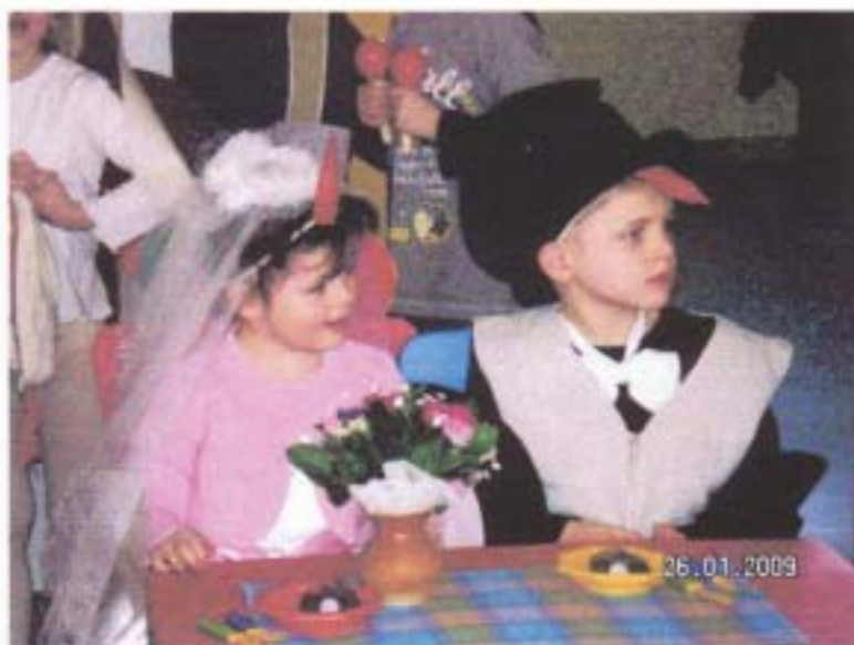
Vogelhochzeit in der Kindertagesstätte "Rotsteinzwerge"

Jedes Jahr am 25. Januar wird in der Oberlausitz die Vogelhochzeit gefeiert. Bei dem alten Brauch der Vogelhochzeit stellen die Kinder der Region alljährlich am Vorabend des 25. Januar einen Teller Vogelfutter in die Fenster und freuen sich am nächsten Tag über eine süße Belohnung für das Füttern der Vögel im Winter.