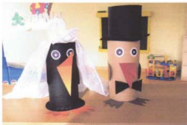
Elster und Rabe in der Kinderkrippe

In diesem Gemeindeblatt erfahren Sie unter anderem: