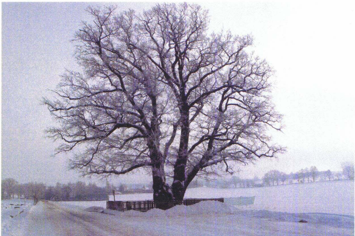
1000 jährige Eiche an der Steinbergstraße

Ziel sei der Friede des Herzens Besseres weiß ich nicht