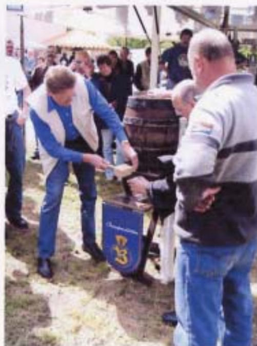
Faßanstich zum Männertag

7.5. ab 20.30 Uhr Live Musik mit der "Cross Blues Band" aus Dresden