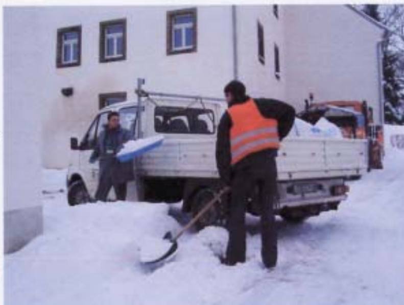
Gemeenearbeiter benn Schnie furtfoarn

De Winter senn o ne mih doas, woas se amol woarn. Wie mer a de Schule gingn, hutt mer noa miher Schnie wie itze. Dr Schnie- pflug koam goar ne durch oalle verschneitn und verwähtn Stroßn. Do misstn de Gemeenearbeiter roaa. Se stoachn mit anner Blaaich- schauffl lauter viereckche Kletzl aus und soatzn se hindern Stroßngrobn zn anner huchn Mauer wieder zu- soamm. Wenn'r ne mih hieging, misste dr Schnie sugoar furtgefoarn warrn.