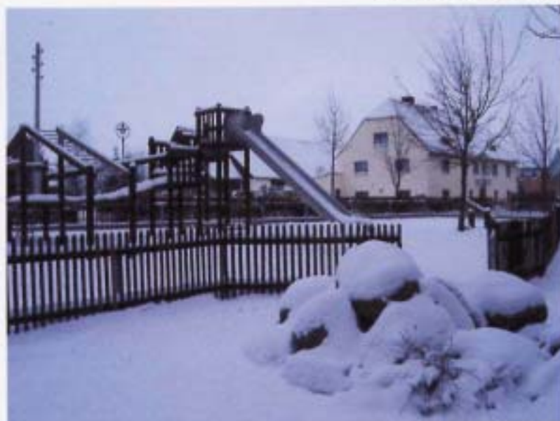
Vill Schnie uff'm Spielplaatze