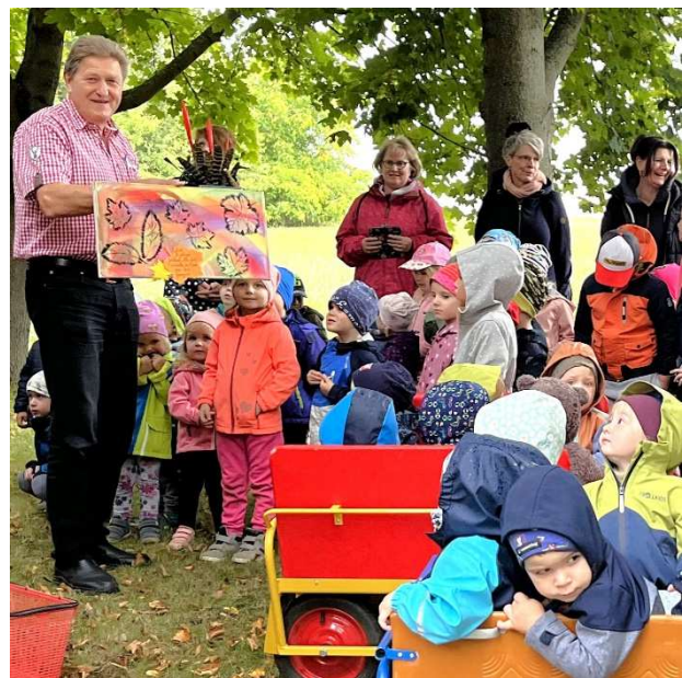
An dem Tag wurde die Gemeindeverwaltung von vielen Gratulanten überrascht!

In diesem Gemeindeblatt erfahren Sie unter anderem: