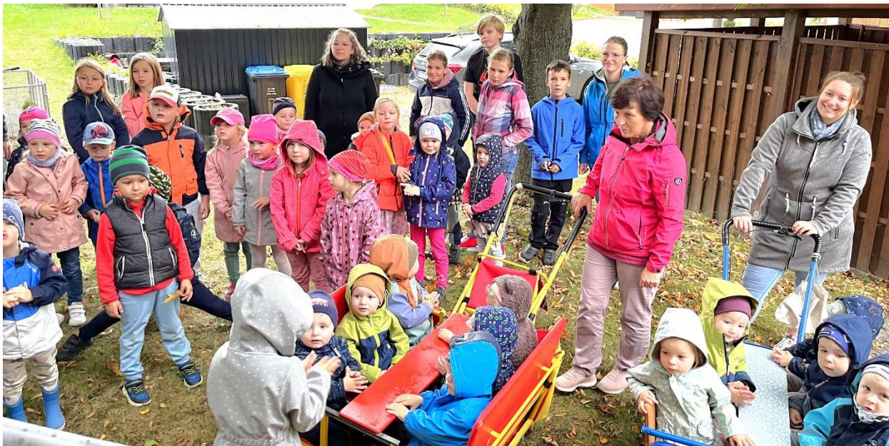
Die Kinder unserer Einrichtungen überbrachten der Gemeindeverwaltung Glückwünsche