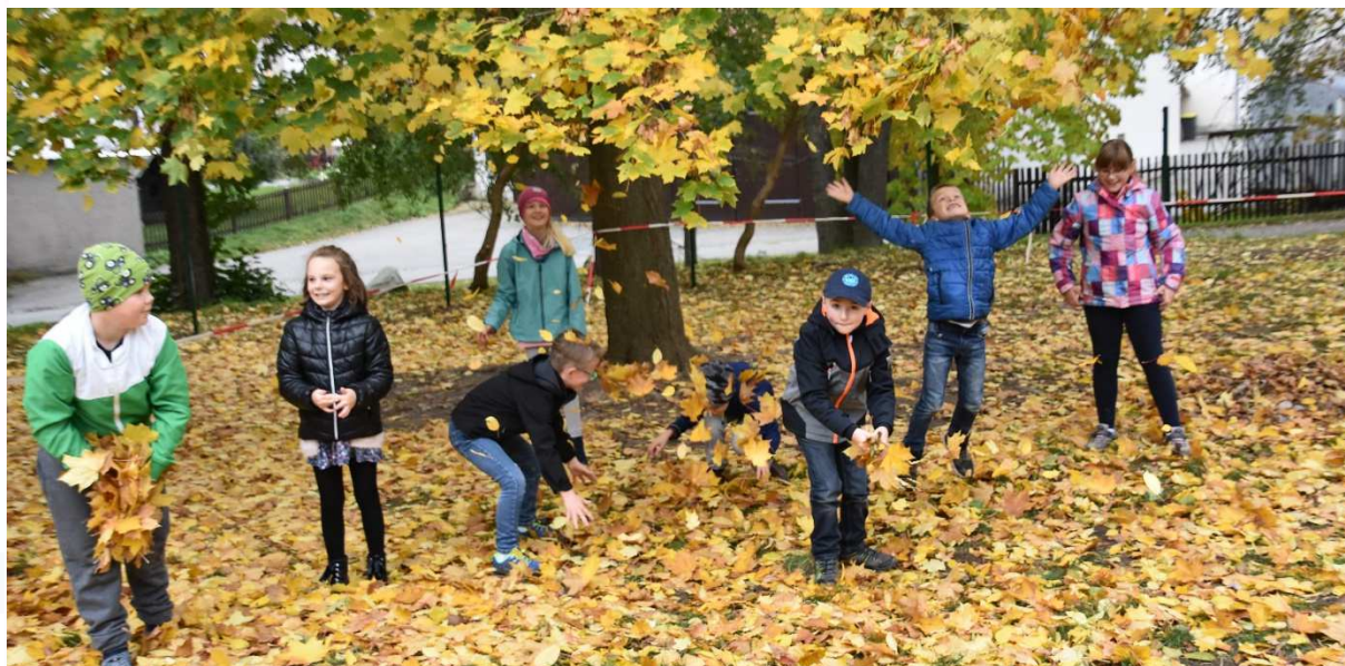
Die Kinder des Hortes „Gernegroß“ genießen die Herbstferien auf dem Spielplatz

In diesem Gemeindeblatt erfahren Sie unter anderem: