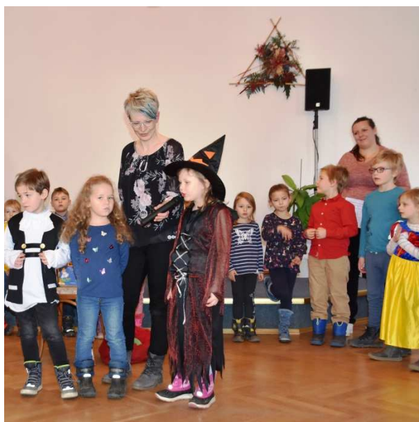
Programm der Kindergartenkinder zu den Seniorenweihnachtsfeiern