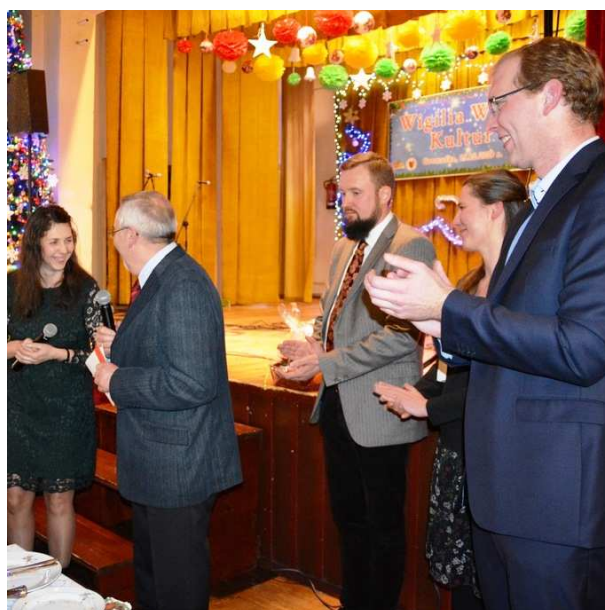
Rosenbacher Delegation besucht die Schlesi-sche Weihnacht in Gromadka

In diesem Gemeindeblatt erfahren Sie unter anderem: