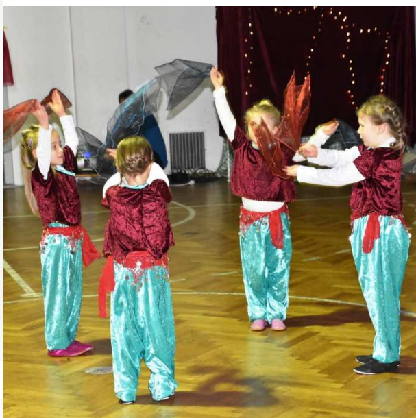
Kinder der Bauchtanzgruppe bei ihren Vorführungen in der Sporthalle Bischdorf.