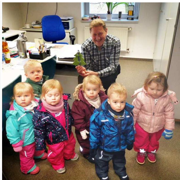
Die Krippenkinder zu Besuch beim Bürgermeister im Gemeindeamt