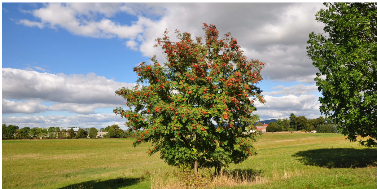
Blick zum ehemaligen Rittergut Oberherwigsdorf

In diesem Gemeindeblatt erfahren Sie unter anderem: