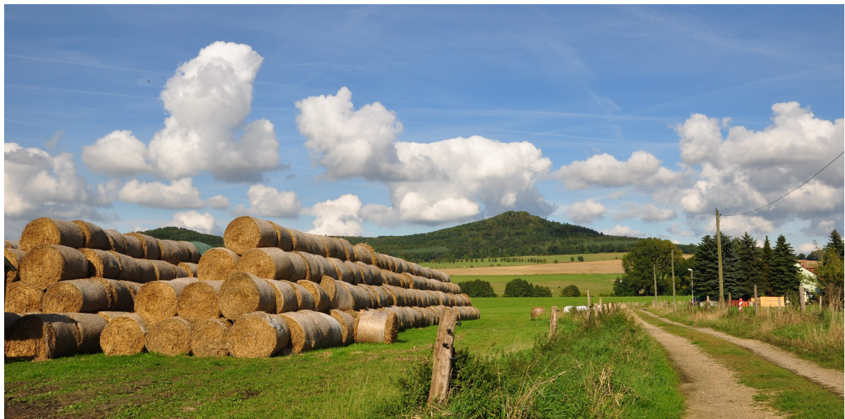
Herbst am Oberhof im Ortsteil Bischdorf

In diesem Gemeindeblatt erfahren Sie unter anderem: