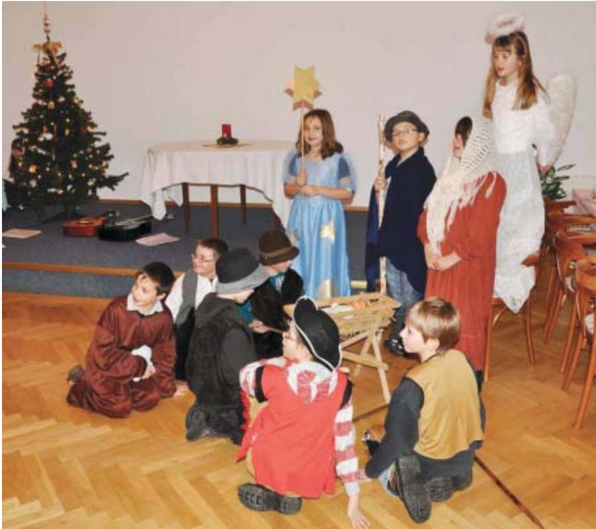
Programm der Schule zu den Seniorenweihnachtsfeiern im letzten Jahr

Liebe Einwohner, das alte Jahr neigt sich dem Ende, ein willkommener Anlass wieder einmal allen recht herzlich zu danken, welche sich um das Wohl unserer Gemeinde und das gute Miteinander im vergangenen Jahr bemühten. Ich wünsche Ihnen allen ein frohes und friedvolles Weihnachtsfest und schon jetzt alles Gute für das Jahr 2012!